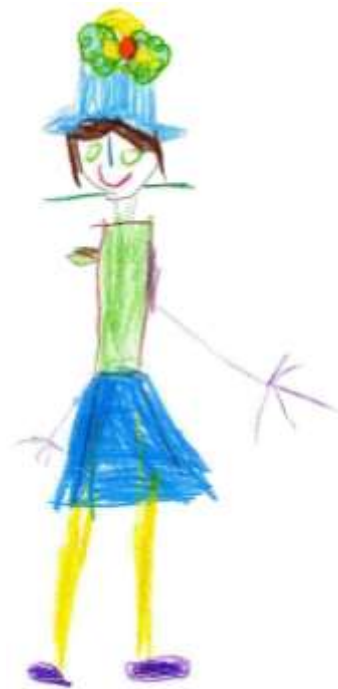
senhora com chapéu

JARDIM DE INFÂNCIA DOS TEMPLÁRIOS AGRUPAMENTO DE ESCOLAS TEMPLÁRIOS